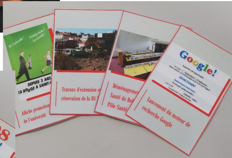
Exemples de cartes au recto : il faut deviner sa date et positionner la carte sur une chronologie en rapport aux autres cartes proposées.